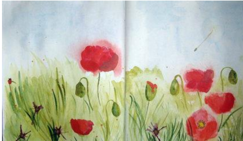
Рисунок по мокрой бумаге — размытое, туманное изображение с эффектом расфокусировки, которое наносится на предварительно смоченный лист бумаги. Лист смачивается чистой водой, затем кистью рисует изображение. Для прорисовки деталей нужно подождать пока рисунок подсохнет, набрать краску и густым мазком с помощью кисти дополнить картину.